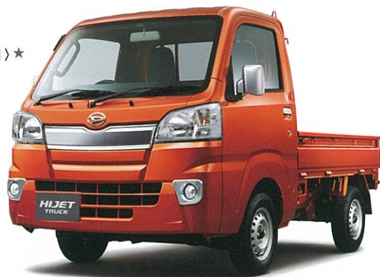
9月末発売予定 トニコオレンジ メタリック (R71) ★