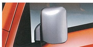
カラード ドアミラー (シルバー) #2