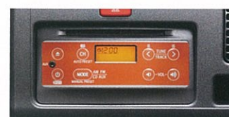
インテグレートCD・AM/FM付ステレオ (CD-R/RWに対応) & 10cm フロントスピーカー+AUX端子/車体色連動カラーフェイスプレート #3