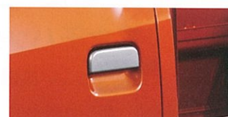
カラードドア アウターハンドル (シルバー) #2