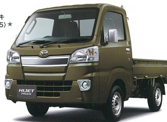
9月末発売予定 オフビートカーキ メタリック (G55) ★