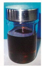
劣化したブレーキフルード