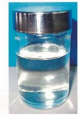
新品のブレーキフルード