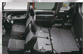
フラットラゲージモード