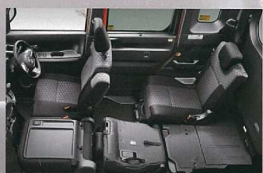
ロングラゲージモード